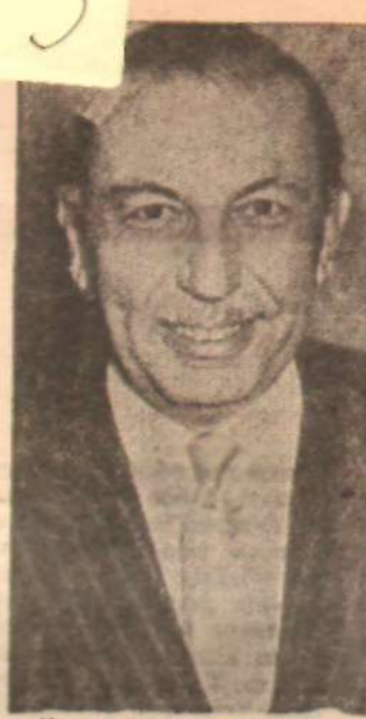
İhsan Sabri Çağlayangil