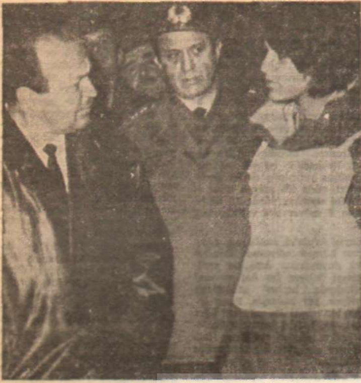
Grev gözçüsü kus, Östrak ile görüşüyor