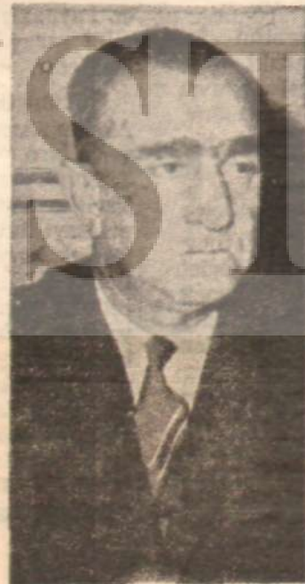
Dâniş Koper Hem alıcı, hem satıcılar