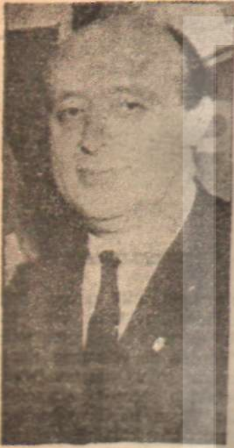
Süleyman Demirel Kayırılan adam

CHP Grubunda yapılan hükümet ile ilgili genel görüşme, bir iç boşaltma ve günah çıkartma toplantısı halinde geçti. Birçok hatip, hükümetin kuruluşunu tenkit etti ve seçimlerde başarı sağlamak için neler yapmak gerektiğini açıkladı. Fakih Özlen gibi, «Partimizin ilkeleri belli: Devletçi, halkçı, laik. Yerimizi tesbit edelim» diyen hatipler azınlıktaydı. Bu tip iç boşaltma fırsatları