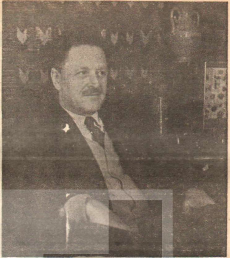
Türk Şairi Nâzım Hikmet

Kendi soyunun tarihi ile birlikte, Türk şairinin tarihi de Nâzım Hikmet'in yapmak istediğini «aşkına basit fakat başarılması güç bir iş haline sokuyordu.