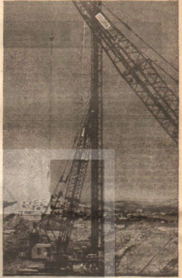
Ereğli-Çelik inşaat alanından görünüş «Devlet malı deniz...»

kuku için gerekli parayı ödeyecekti. İlk finansman plânı, 19 milyon dolar faizsiz avans ve 178 milyon lira kredi şeklindeydi. Yani 360 milyon liradan ibaretti. Ama şimdi Hazine'nin yardımı 900 milyon lirayı bulmuştu. Bu yıl bütçeden 353 milyon lira verilmişti. Melen, «Yetkimiz yok ama tetkik ettirdim. Durumu uygun görmezince tediyeyi durdurdum» diyordu. Ne var ki Amerikada Başbakan, Ereğli-Çelik'in hem kurucusu hem satıcısı olan Koppers'in güçlü temsilcileri sıkıştırılmışlar, Başbakan da Amerikadan telefon ederek, ödemenin yapılmasını istemişti. Ereğli-Çelik'e 1965 bütçesinden de 163 milyon lira ve rilmekteydi.