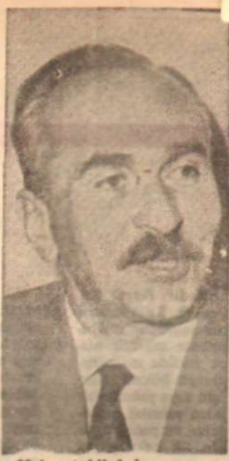
Mehmet Ali Aybar