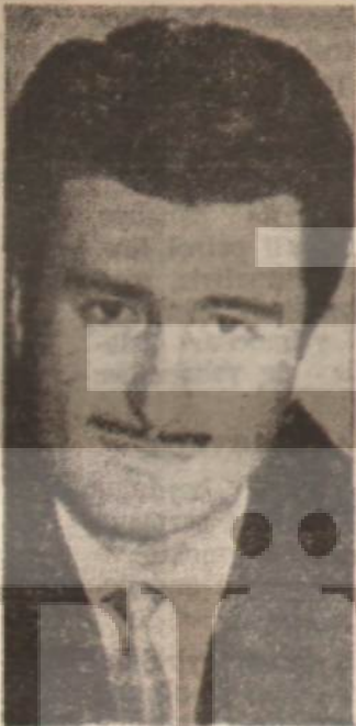
Hüdaî Oral Milliyetçilik böyle olur

Maliye Bakanı Ferit Melen, CHP grubunda açıkladı: Konsorsiyum, yardım şartlarından biri olarak liberal bir maden kasuunu hazırlanmasına ileri sürüyormuş... Bunun anlamı, Türkiye maden zenginliklerini yabancı şirketlere peşkes çeksin demektir. Az kaldı çekiyordu da... Bir Amerikalı uzman, yabancı maden şirketlerinin emellerine uygun bir tasarı yüksek ücretler ödeyerek hazırlanmıştı. Bereket, ağır baskılara rağmen, Türk petrolünün ve Türk maden kaynaklarının milletlerarası tekelilere peşkes çekilmesini önlemek için büyük çaba gösteren Enerji ve Tabii Kaynaklar Bakanı Hüdaî Oral, yabancıların bu oyununa gelmedi ve yeni bir tasarı hazırlatma yoluna gitti. Konsorsiyum üyeleri şimdi «Sözün yardım vermeyiz» tehdidiyle, bu hazırlığı durdurmak ve madenlerimizle el koymak istemektedirler!