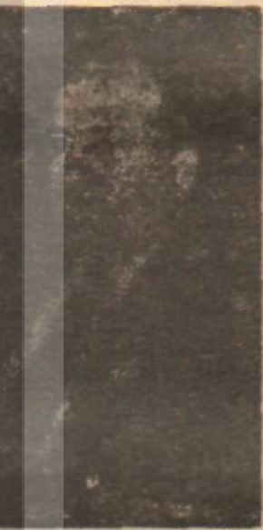
Behçet Osmanağaoğlu Taviz hücumu

1965 Mali Yılı Bütçe Gerekçesi, 1963 yılında milyonerlerimizden sayısında önemli bir sıçrama olduğunu gösteriyor. 1960 da 110 milyonerimiz vardı. Milyonun üstünde yıllık gelir sağlayanların sayısı 1961 de 108'e, 1962'de ise 83'e düşmüştü. Bu rakam 1963 te 117'ye çıkmıştır. Ne var ki milyonerlerin sayısında bir yılda yüzde 40 artış kaydedememize rağmen, ver-